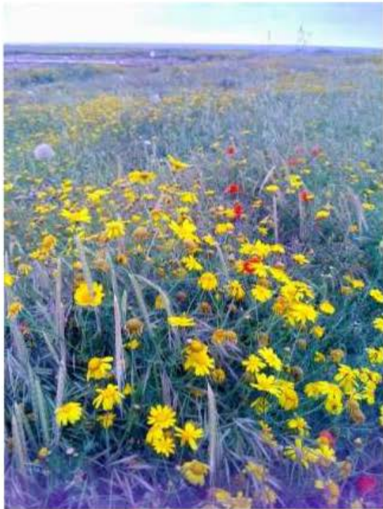
printemps à Chypre, photo Evelyne Dreyfus